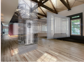
〈TABULA SCRIPTA SAPPORO〉 展示イメージ